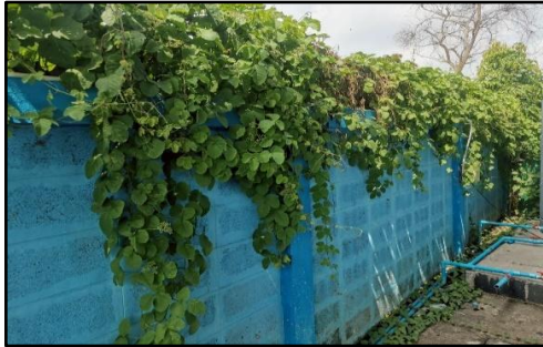
ภาพถ่ายด้านซ้ายอาคาร