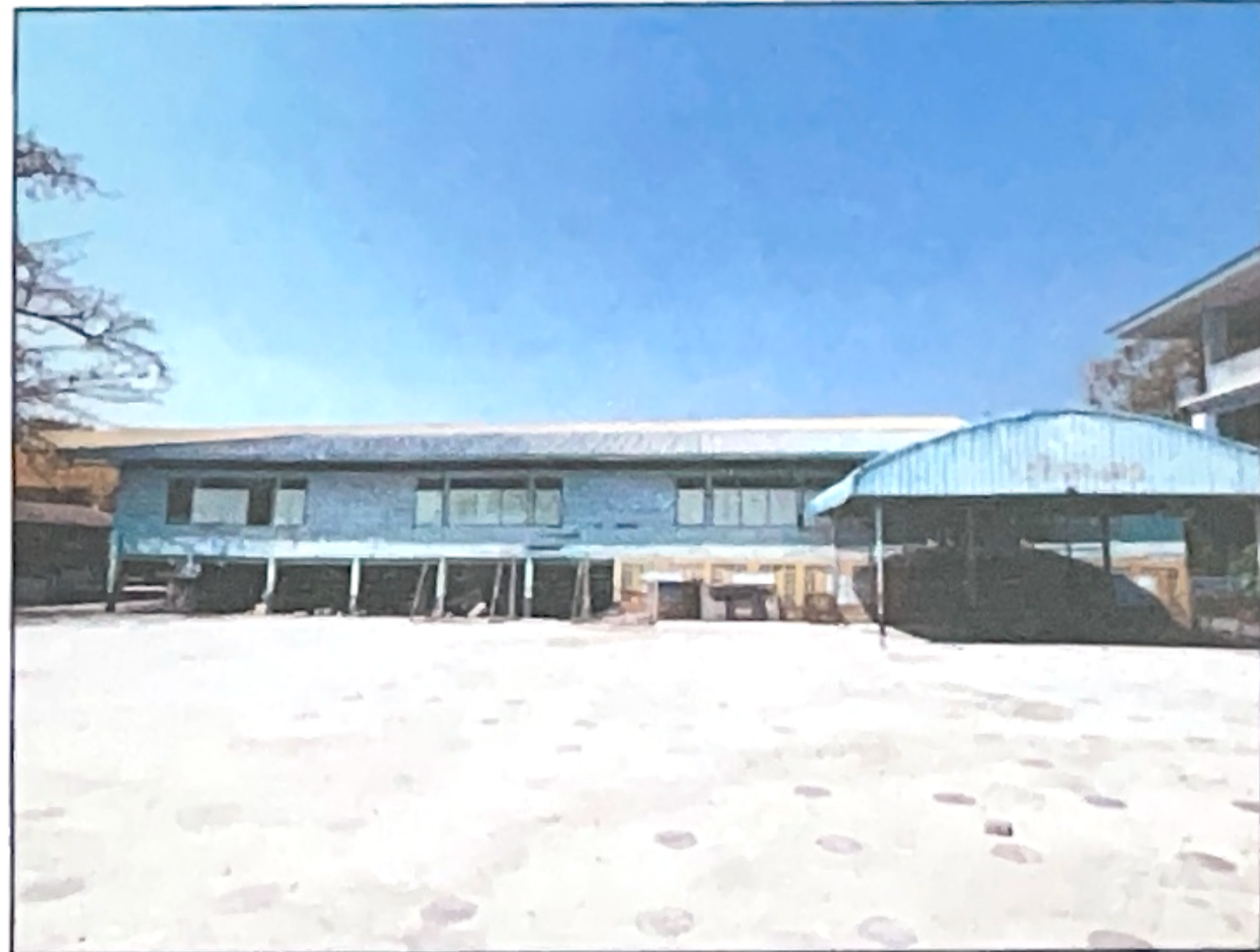
ภาพถ่ายด้านหลังอาคาร