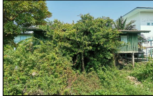
ภาพถ่ายด้านหลังอาคาร