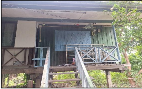
ภาพถ่ายด้านหน้าอาคาร