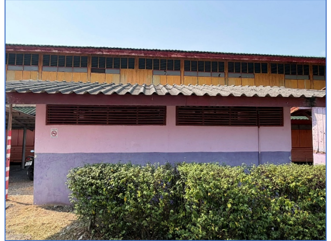
ภาพถ่ายด้านหลังอาคาร