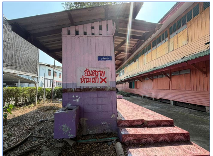
ภาพถ่ายด้านซ้ายอาคาร