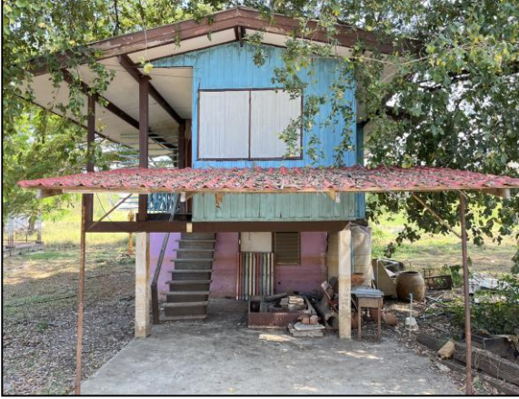
ภาพถ่ายด้านหน้าอาคาร