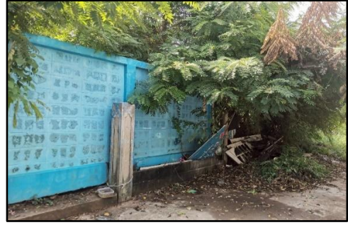
ภาพถ่ายด้านหลังอาคาร