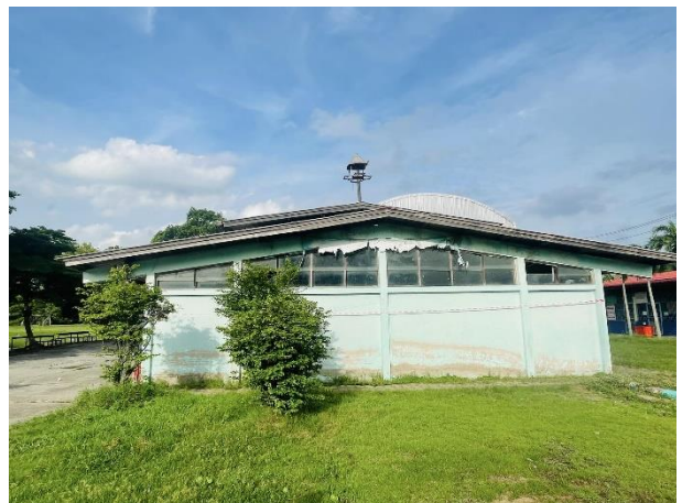
ภาพถ่ายด้านขวาอาคาร