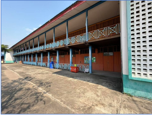
ภาพถ่ายด้านหน้าอาคาร