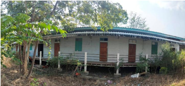
ภาพถ่ายด้านซ้ายอาคาร