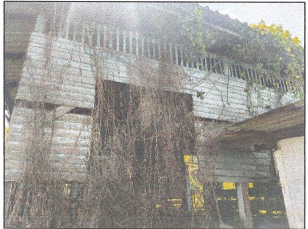
ภาพถ่ายด้านหลังอาคาร