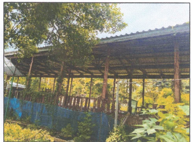
ภาพถ่ายด้านขวา