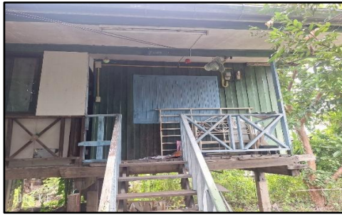
ภาพถ่ายด้านหน้าอาคาร