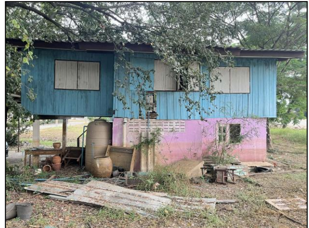
ภาพถ่ายด้านขวาอาคาร