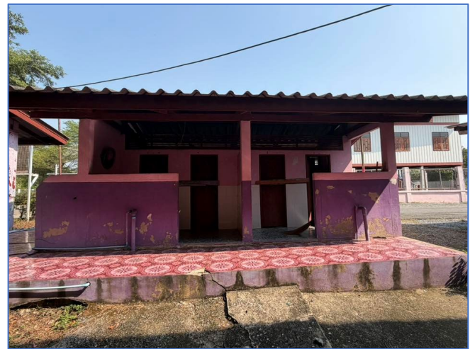
ภาพถ่ายด้านหน้าอาคาร