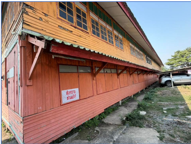
ภาพถ่ายด้านหลังอาคาร