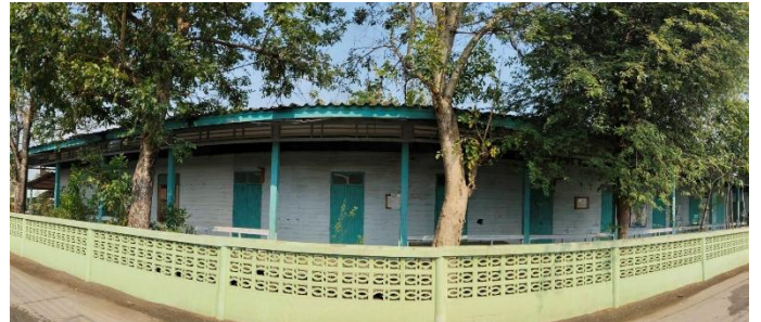
ภาพถ่ายด้านขวาอาคาร