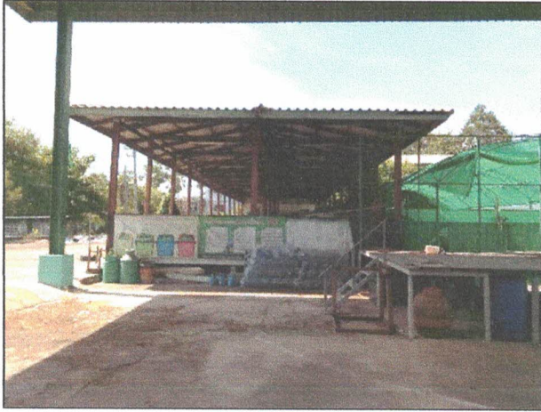
ภาพถ่ายด้านหน้าอาคาร