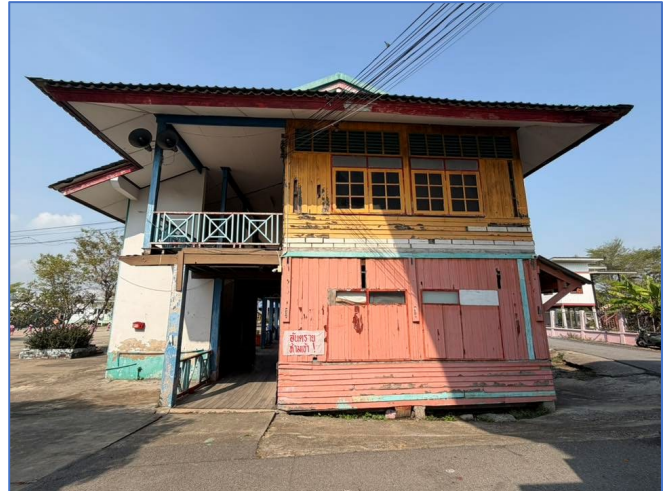
ภาพถ่ายด้านขวาอาคาร