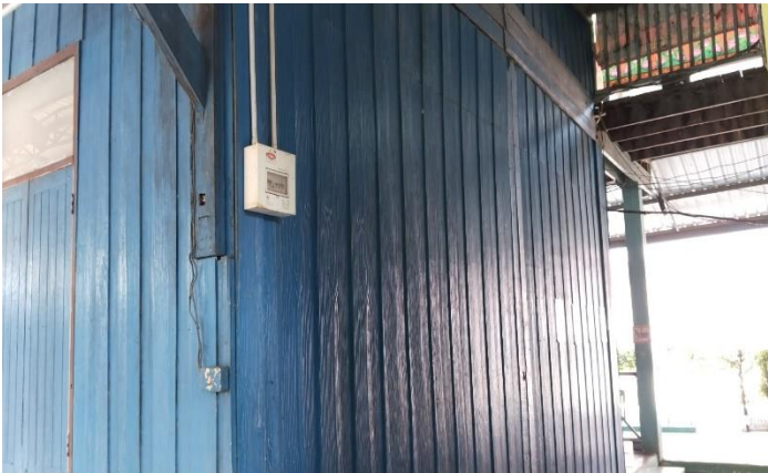
ภาพถ่ายด้านซ้าย