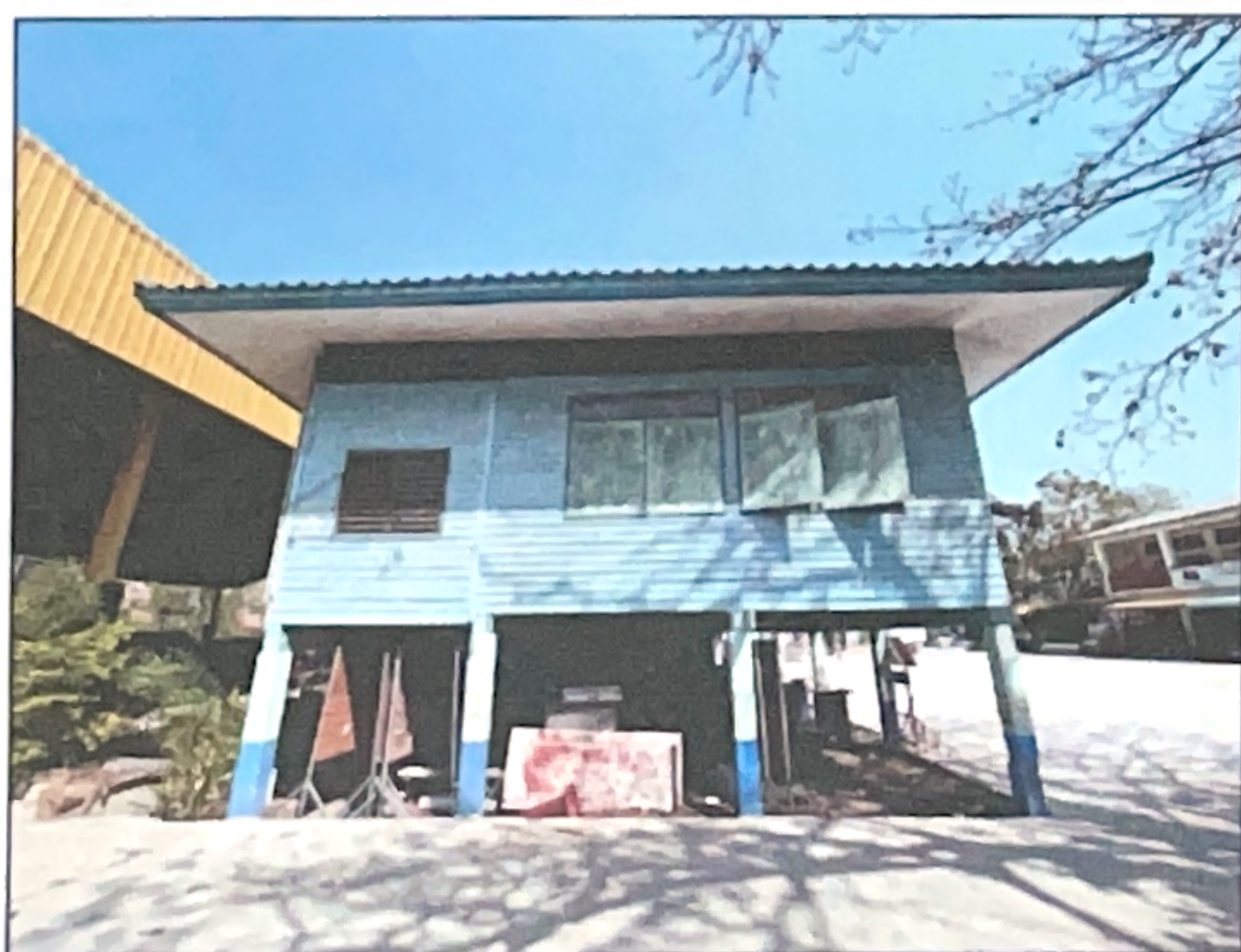
ภาพถ่ายด้านซ้ายอาคาร