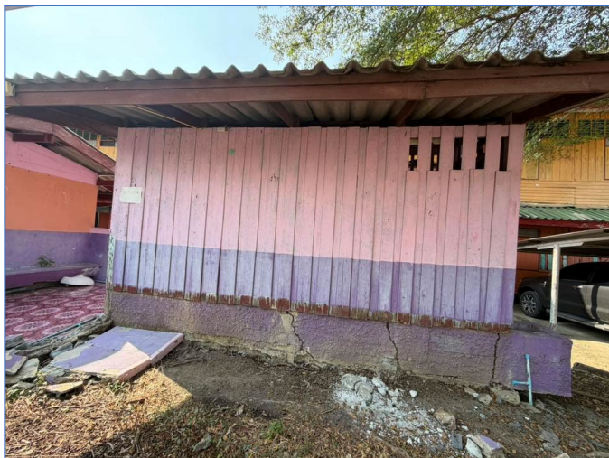
ภาพถ่ายด้านหลังอาคาร