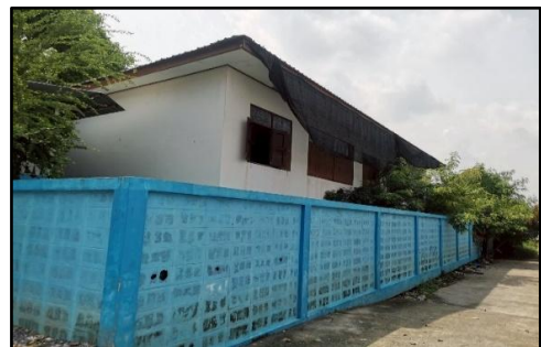
ภาพถ่ายด้านขวาอาคาร

รับรองว่าเป็นภาพถ่ายอาคารที่ขอรื้อถอนจริง