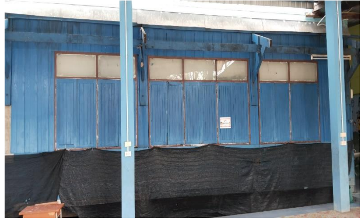
ภาพถ่ายด้านหลังอาคาร