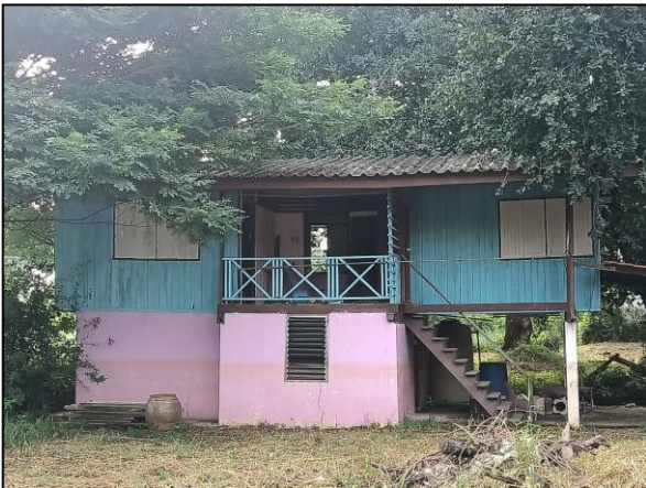
ภาพถ่ายด้านซ้ายอาคาร