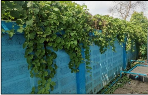
ภาพถ่ายด้านซ้ายอาคาร