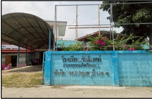
ภาพถ่ายด้านหน้าอาคาร