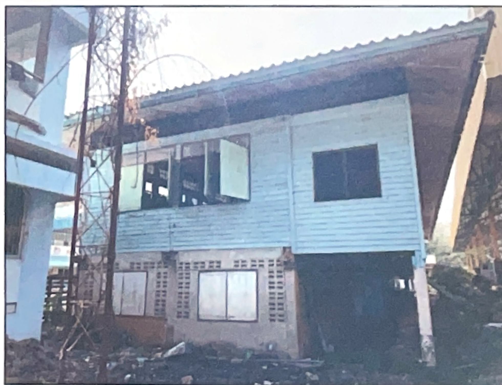
ภาพถ่ายด้านขวาอาคาร