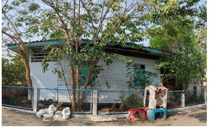
ภาพถ่ายด้านหลังอาคาร