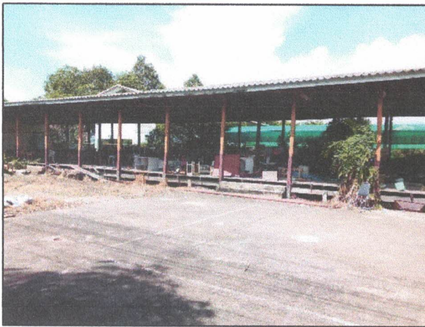
ภาพถ่ายด้านซ้าย