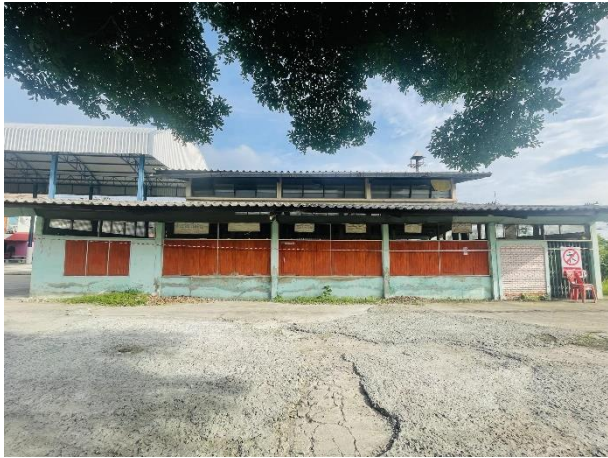
ภาพถ่ายด้านหน้าอาคาร