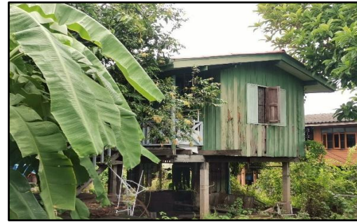
ภาพถ่ายด้านขวาอาคาร

รับรองว่าเป็นภาพถ่ายอาคารที่ขอรื้อถอนจริง