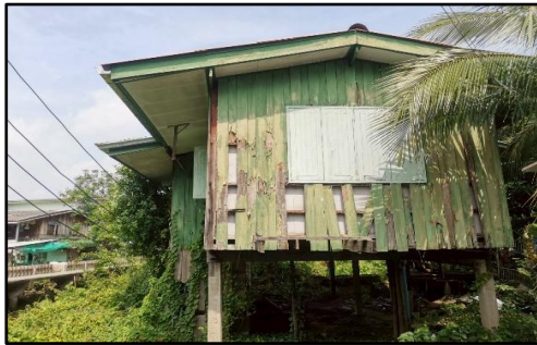
ภาพถ่ายด้านซ้ายอาคาร