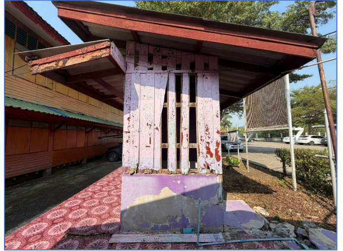
ภาพถ่ายด้านขวาอาคาร