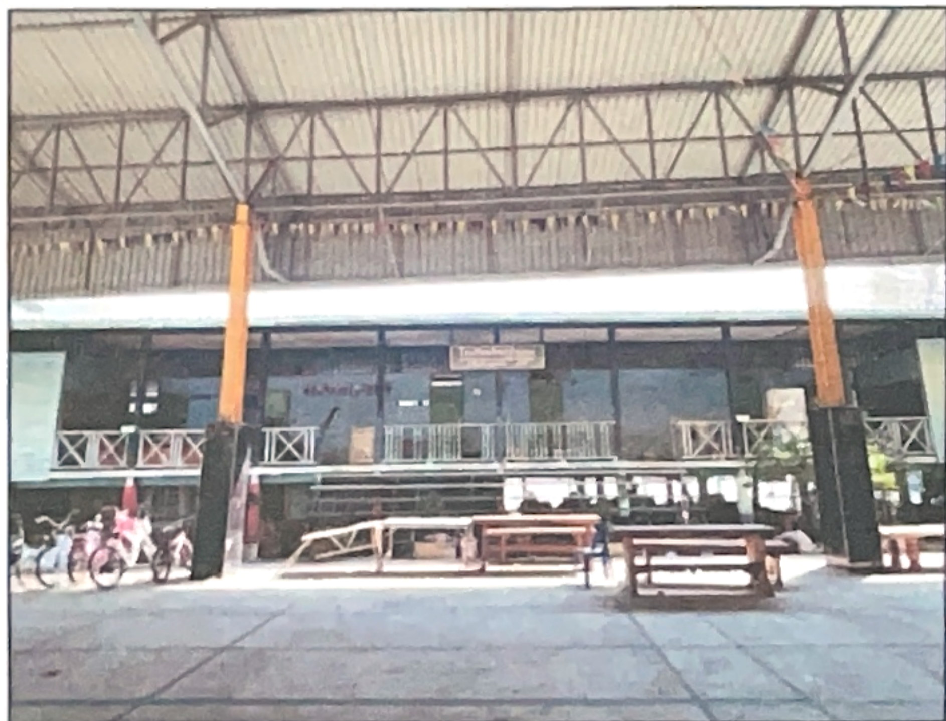
ภาพถ่ายด้านหน้าอาคาร