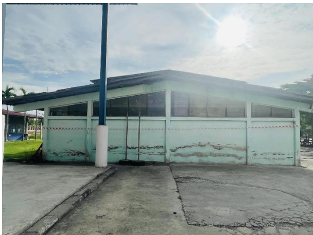
ภาพถ่ายด้านซ้ายอาคาร