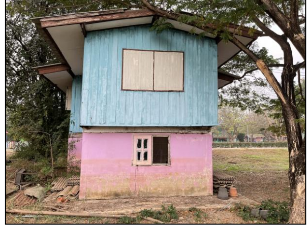
ภาพถ่ายด้านหลังอาคาร