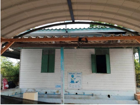
ภาพถ่ายด้านหน้าอาคาร