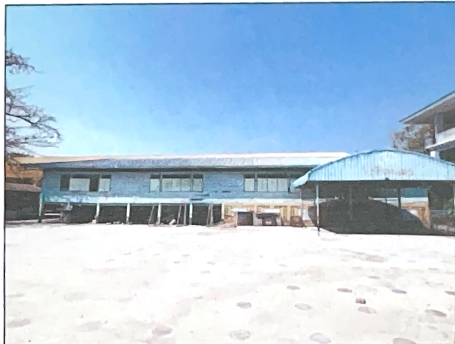
ภาพถ่ายด้านหลังอาคาร