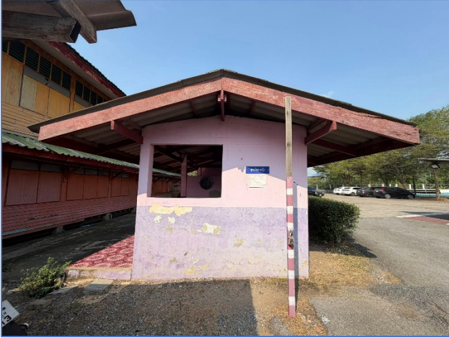
ภาพถ่ายด้านขวาอาคาร