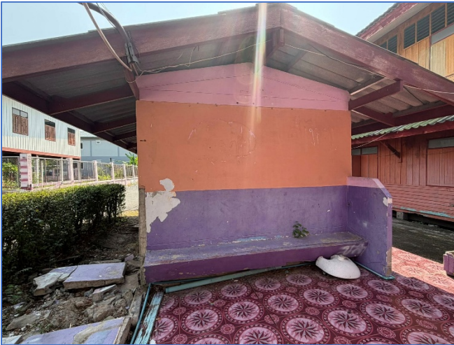
ภาพถ่ายด้านซ้ายอาคาร