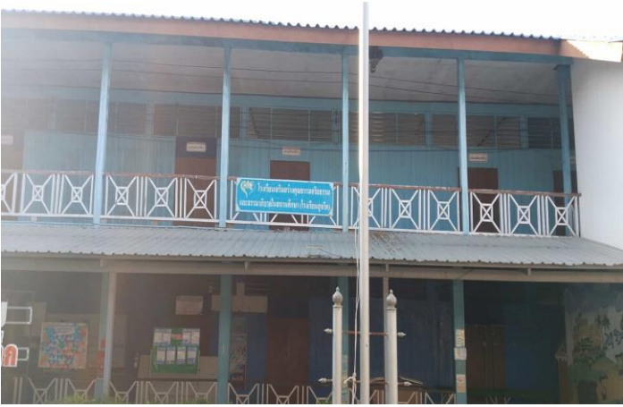
ภาพถ่ายด้านหน้าอาคาร