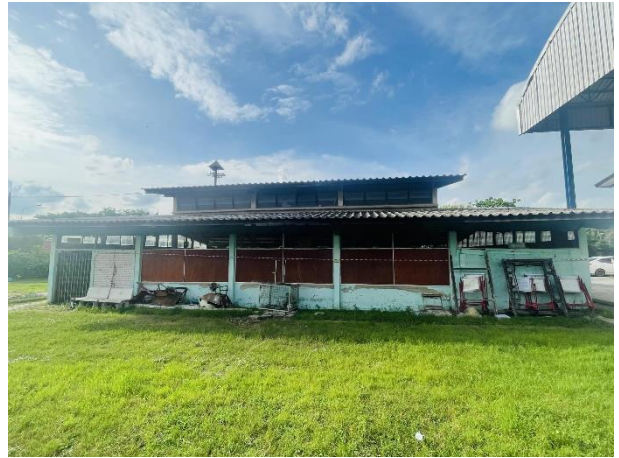
ภาพถ่ายด้านหลังอาคาร