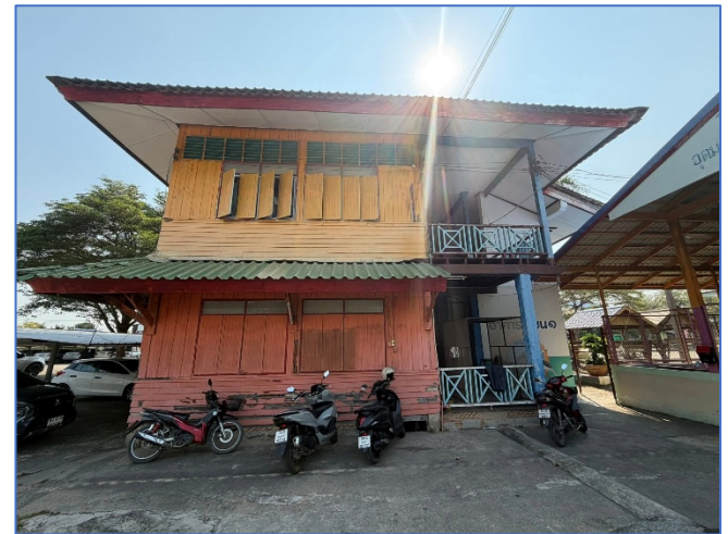
ภาพถ่ายด้านซ้ายอาคาร