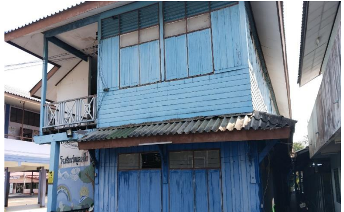
ภาพถ่ายด้านขวา