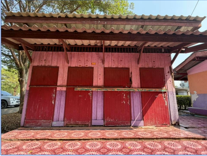
ภาพถ่ายด้านหน้าอาคาร